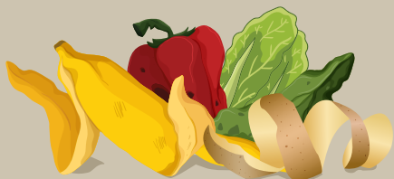
ÉPLUCHURES DE FRUITS ET DE LÉGUMES (Y COMPRIS AGRUMES ET ÉPLUCHURES D'OIGNONS)