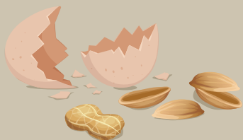
COQUILLES D'OEUF ÉCRASÉES ET FRUITS SECS