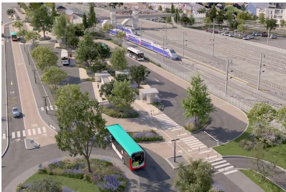
Vue de la gare routière depuis le rond-point de l'hôpital

Ses travaux avaient débuté l'été dernier, une fois les pétales de la rotonde sud de la passerelle fixés à l'ouvrage. L'espace libéré avait en effet permis d'engager les travaux d'aménagement de l'infrastructure. Après quatre mois de travaux, cette phase de chantier est sur le point d'aboutir. La gare routière sera mise en service ce lundi 27 octobre.