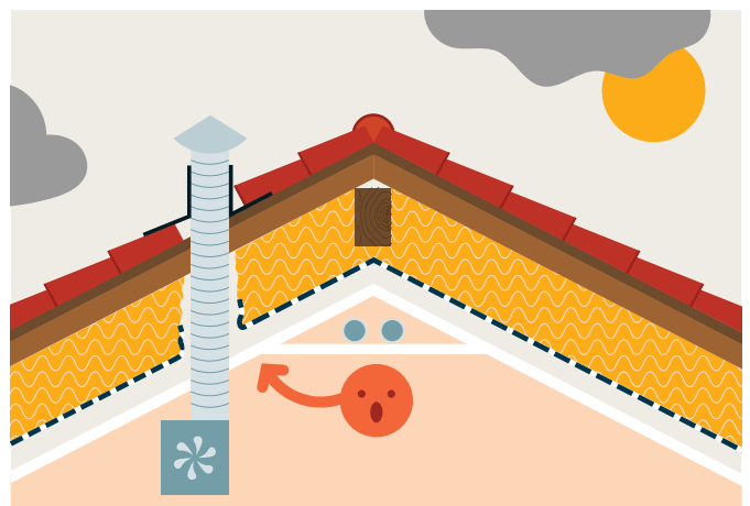
Étape 2 Installation d'une ventilation