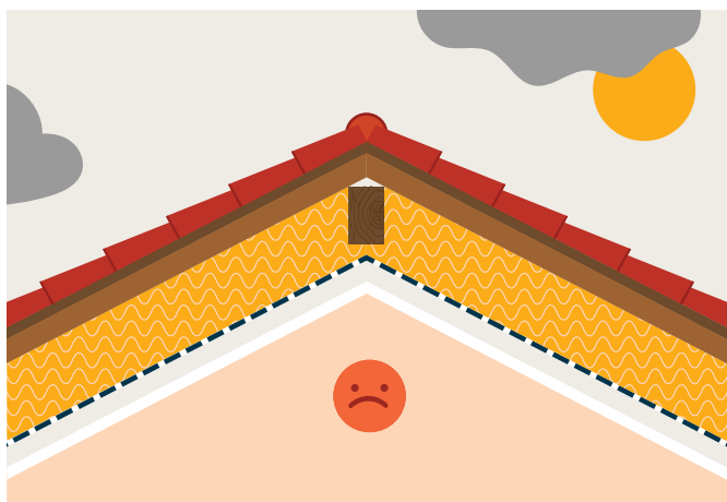
Étape 1 Isolation de la toiture par l'intérieur