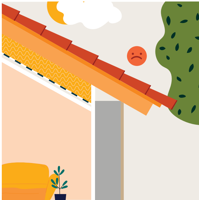
Étape 1 Isolation des rampants