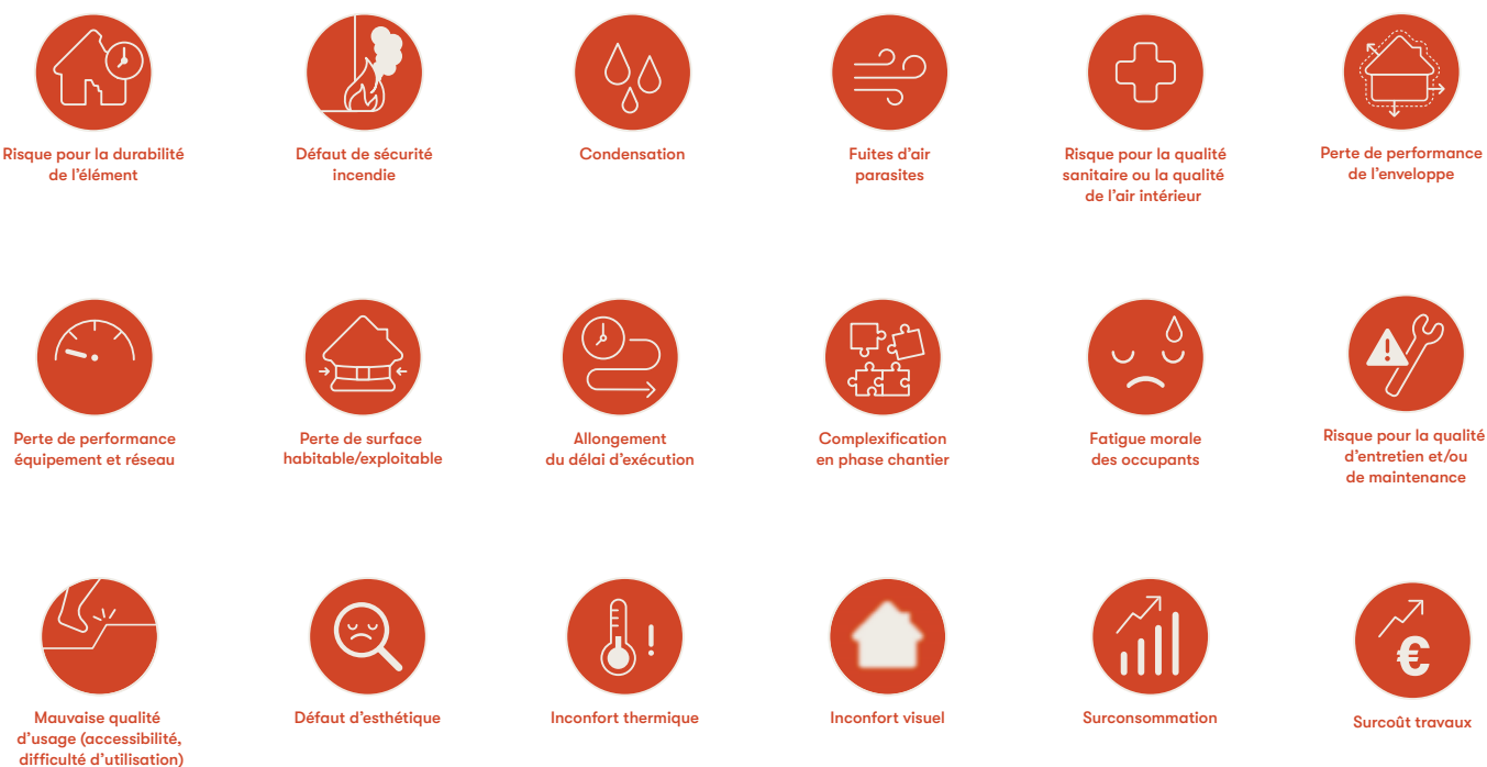
Figure 1 Les pictos représentant les 18 impacts

Sur chaque fiche, les impacts sont facilement identifiables grâce à des pictogrammes. Ils comparent l'état de l'interface après les 2 étapes de travaux avec une rénovation des mêmes postes réalisés en même temps (1 seule étape). Les conseils correctifs modifient les impacts mais peuvent en générer de nouveaux (surcoût, délais supplémentaires, ...).