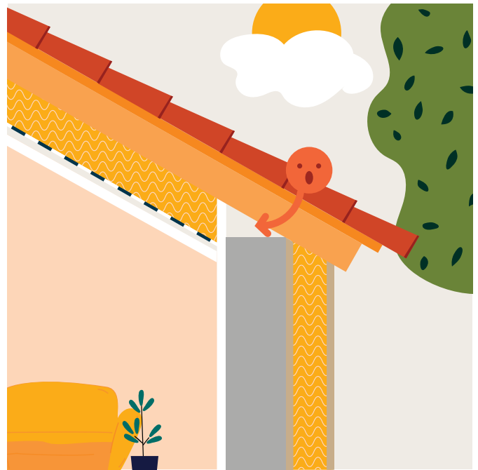
Étape 2 Isolation des murs par l'extérieur