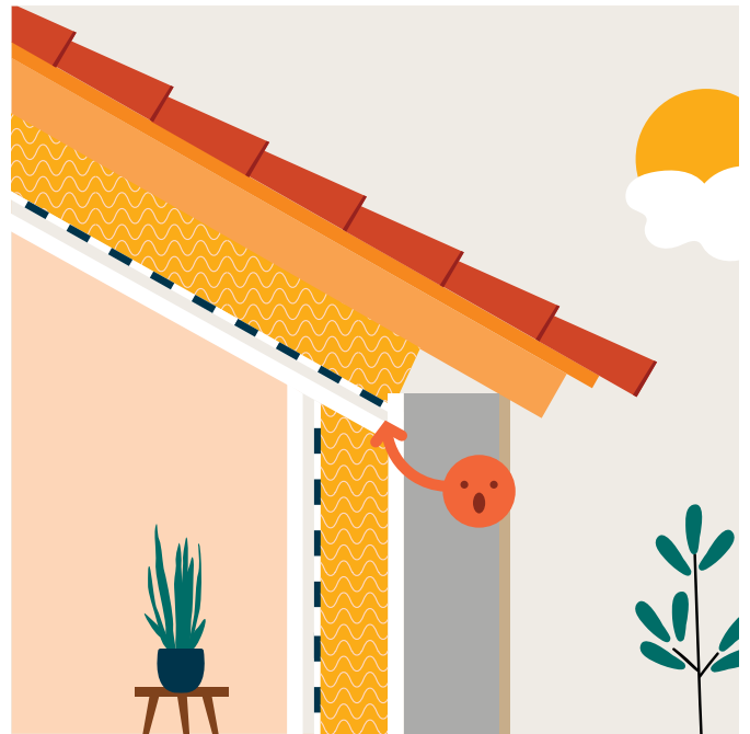
Étape 2 Isolation des murs par l'intérieur