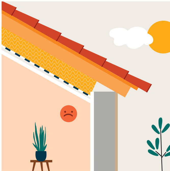
Étape 1 Isolation des rampants